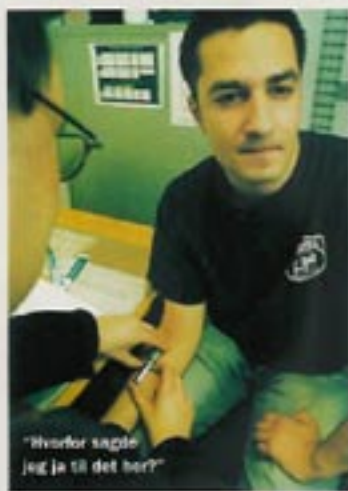
"Hvorfor sagde jeg ja til det her?"

På Gentofte politistation får vi taget en blod- prøve af en lege, der er på nattevagt. Prøven er det ultimative bevis for politiet i en straffesag vedrørende promille- eller spirituskørsel. For at få den mest nøjagtighed analyserer Retsmedicinsk Instituts blodprøven på den anholdte hele to gange. Derefter sender legen middeleværdien af de to resultater og mærker 0,1 promille fra den. På den måde tilgodeser