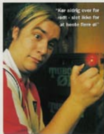
"Ker aldrig over for rødt - det ikke for at handle flere af"

alkoholforbrug, hvis du pludselig bruger Bå- dellens alkoholtest som nøglering. Alene ad- scendet på mælken sender troværdigheden helt i bund, da den ligner et apparat, der er lever på ti minutter i en baggedalsbutik i Bangkok. Tansen til 300 kroner kan kun måle to promille. Hvis man har en promille på 0,2, altså på den rigtige side af det lovlige, ly- ser den gult, når man har passer i den lille munding. Har man 0,5 eller over, så lyser den rødt. Vi får kun apparatet til at lyse rødt,