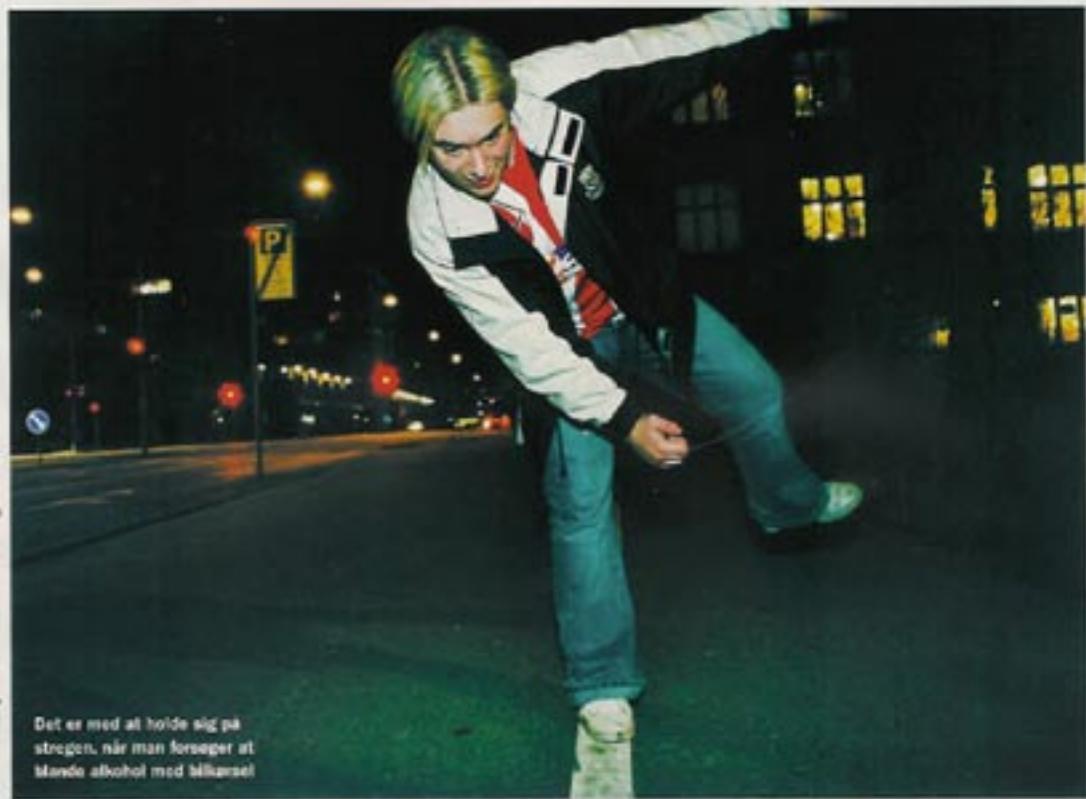
Det er med at holde sig på stregen, når man forsøger at mande alkohol med bilkørsel

alkoholforbrug, hvis du pludselig bruger Bå- dellens alkoholtest som nøglering. Alene ad- scendet på mælken sender troværdigheden helt i bund, da den ligner et apparat, der er lever på ti minutter i en baggedalsbutik i Bangkok. Tansen til 300 kroner kan kun måle to promille. Hvis man har en promille på 0,2, altså på den rigtige side af det lovlige, ly- ser den gult, når man har passer i den lille munding. Har man 0,5 eller over, så lyser den rødt. Vi får kun apparatet til at lyse rødt,